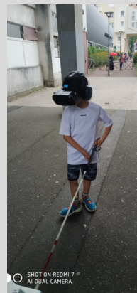
Sensibilisation au Foyer Clémentine - Noisiel ( 77)

www.irsam.fr/toutes-les-actualites/2022/journee-mondiale-de-la-surdicecite/ https://blog.irsam.fr/clairfontaine/2022/07/06/yarn-bombing-2022/