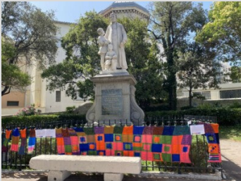
IES Arc en ciel - Marseille (16)