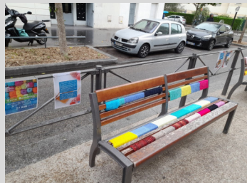
Foyer Clairefontaine - Lyon (69)