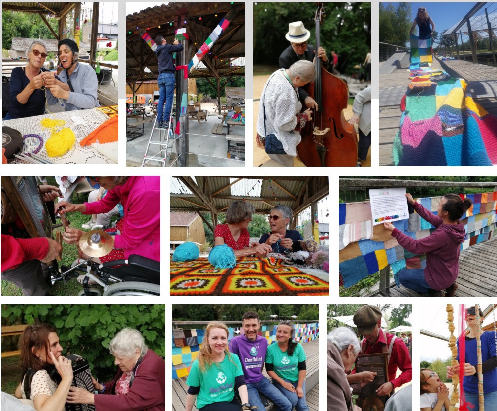
Photos du Yarn Bombing à Poitiers, îlot Tison.

Merci aux personnes en situation de surdicécité, aux familles, merci aux établissements et services spécialisés, merci à tous les volontaires, sensibilisés ou non à la surdicécité, quelle que soit la forme de leur participation, merci à toutes les tricoteuses pour vos mailles solidaires, vos carrés par milliers, merci aux couturières qui les ont assemblés, merci à ceux qui se sont prêtés au jeu et sans qui nous n'aurions jamais pu yarn-bombarder l'îlot Tison de Poitiers. Merci à ceux qui ont mis en images et porté sur les ondes la surdicécité, merci à celles et ceux qui sont venus jusqu'à nous, toutes les personnes qui ont osé poser des questions et échanger, qui se sont sincèrement intéressées à ce handicap rare. Merci à vous tous qui avez rendu cette journée joyeuse et festive !