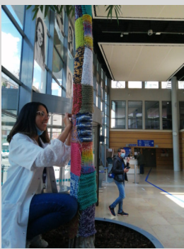
EHSR de l'hôpital Sainte Marie - Villepinte (93)