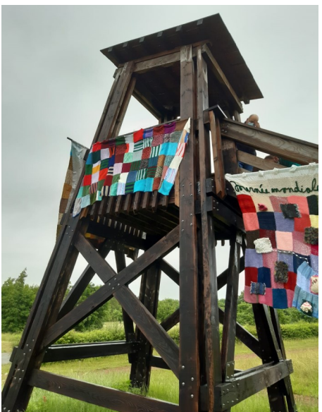
Foyer d'Accueil Médicalisé Quenehem à Calonne-Ricouard (62)