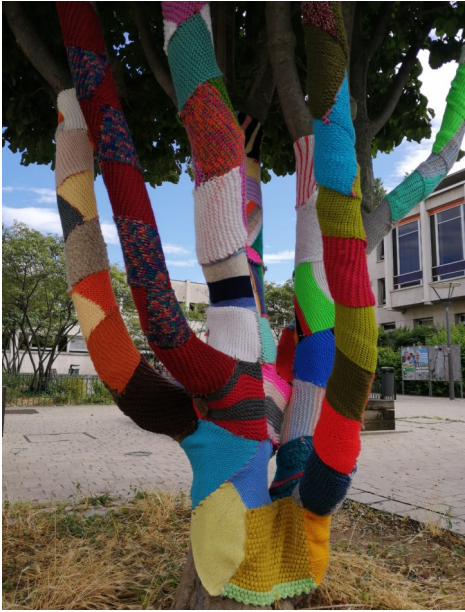
Association IRSAM Lyon (69)

D'autres initiatives ont vu le jour en région. Voici les exemples de l'association IRSAM de Lyon, l'IRSAM de Marseille, La Maison d'Accueil Spécialisée Le Château de Brax, le Foyer d'Accueil Médicalisé Liorzig à Pluneret et le Foyer d'Accueil Médicalisé Quenehem à Calonne-Ricouard.