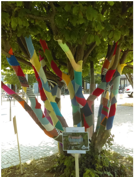
Association IRSAM Lyon (69)