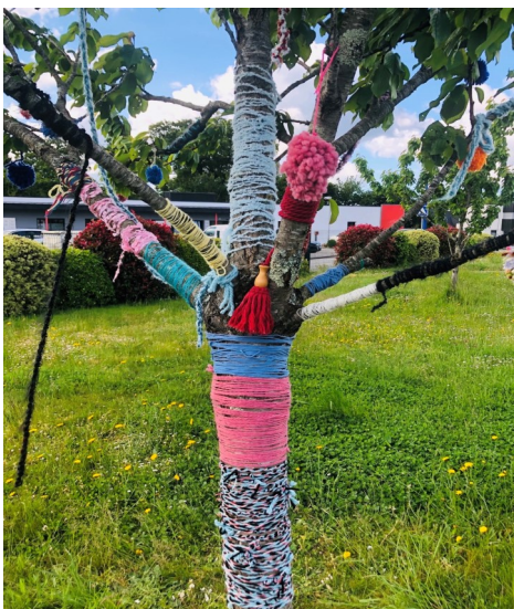
Foyer d'Accueil Médicalisé Liorzig à Pluneret (56)