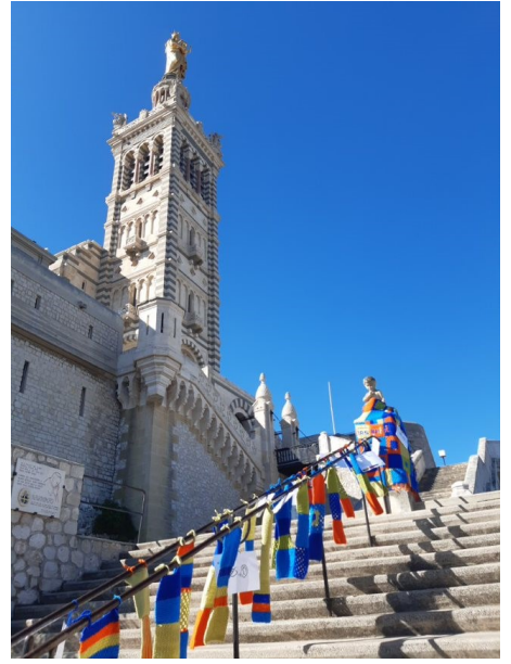
Association IRSAM Marseille (13)