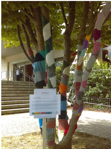
Association IRSAM Lyon (69)