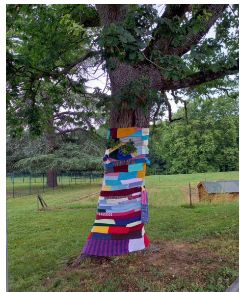
Maison d'Accueil Spécialisée Le Château de BRAX (31)