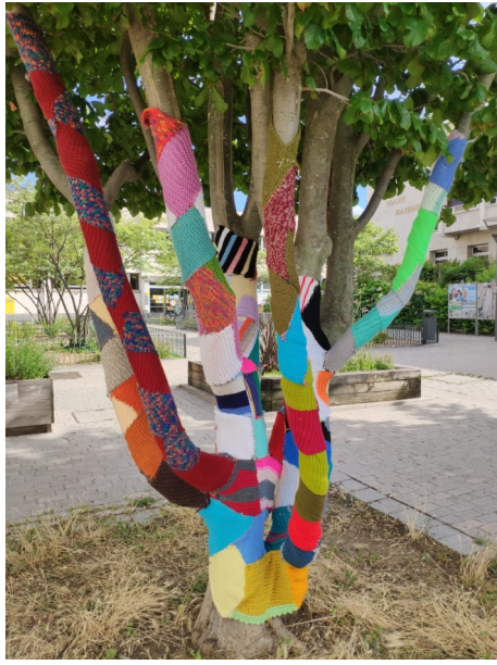
Association IRSAM Lyon (69)