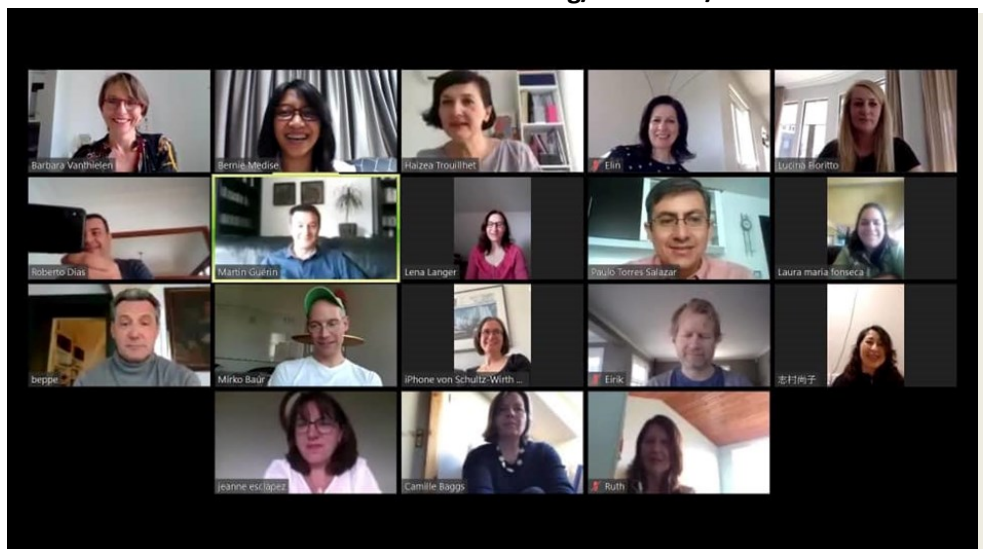
Capture d'écran de 18 visages de participants qui suivent le webinaire depuis leur pays.

Si vous êtes intéressés, les vidéos sont accessibles et sous-titrées en anglais sur le site de Dbi : www.deafblindinternational.org/webinars/