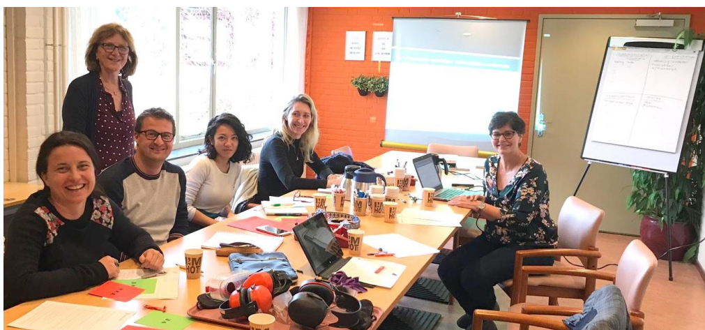
L'équipe de Kalorama présente sa pratique de formation à l'équipe du Cresam.

Nous avons donc ramené dans nos bagages nombre d'idées à mettre en application dans notre pays !