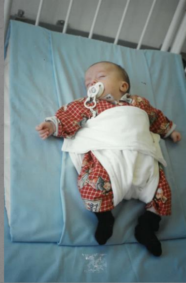
Derniers jours avant le diagnostic