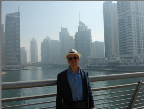
Dubai . . .