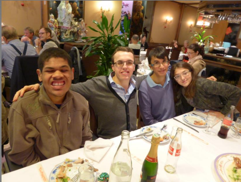
Avec les amis la vie est belle!...